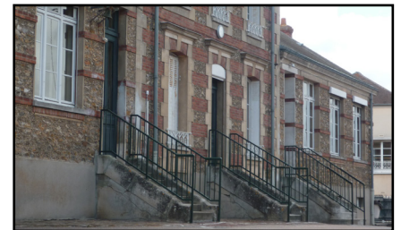
Rampes d'escaliers, 2012

Aujourd'hui , le bâtiment est resté inchangé à l'extérieur comme à l'intérieur où beaucoup d'éléments ont été préservés. La disposition des différents espaces est la même, à quelques cloisons près. Les sols en parquet ou tomettes, les foyers de cheminée et certaines pièces du mobilier dont des placards à instruments de mesure et de vieilles tables d'écoliers sont encore en place. La mairie est devenue salle de classe, une partie du logement de l'instituteur a été transformée en une troisième classe, tandis que l'étage sert d'espace de stockage.