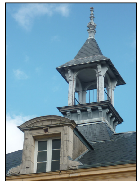
Campanile, 2012

« La municipalité actuelle porte le plus grand intérêt à l'instruction ; [...] elle est prête à faire les plus grands sacrifices pour améliorer de plus en plus la situation et le bien-être des enfants. »