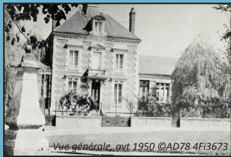
Vue générale, avt 1950 ©AD78 4Fi3673