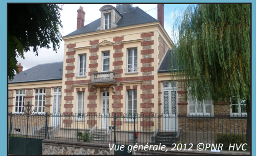
Vue générale, 2012